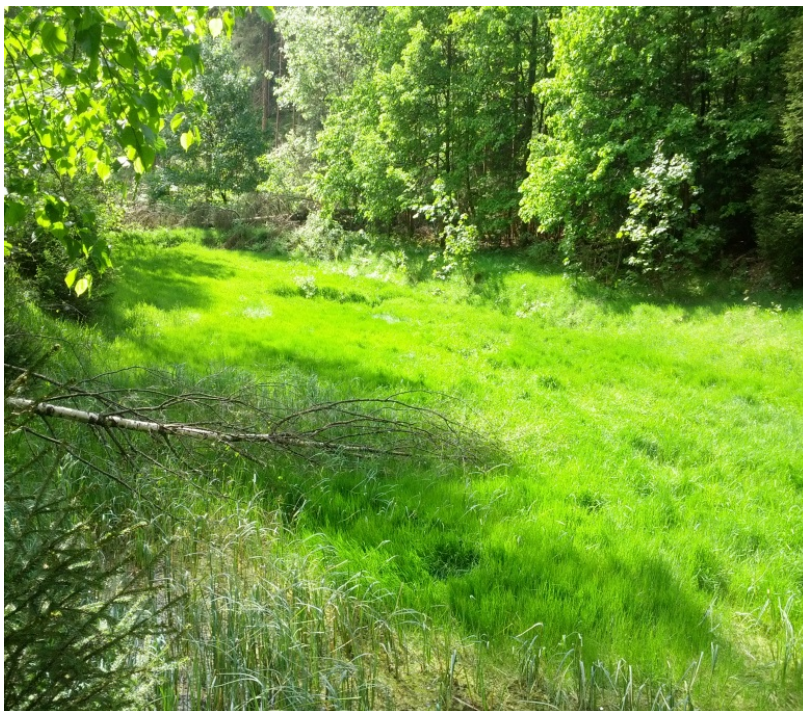
Teich bei der Wilzschmühle