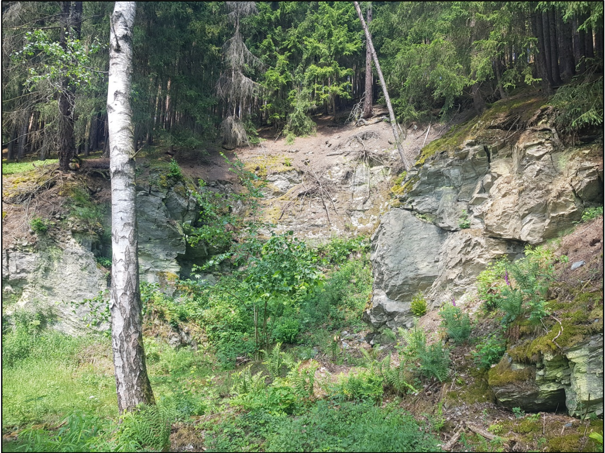
Abb. 2: Habitatideal eines ehemaligen Steinbruch als „Sonnenfalle“ vor der Pflegemaßnahme im Revier Bad Elster