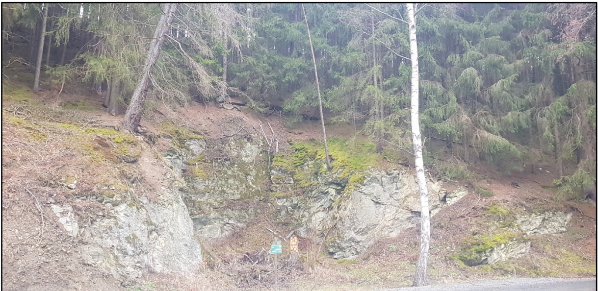
Abb. 3: Maßnahmenabschluss am Steinbruch im Kreuzotter-Habitat des Teterweinbachtal