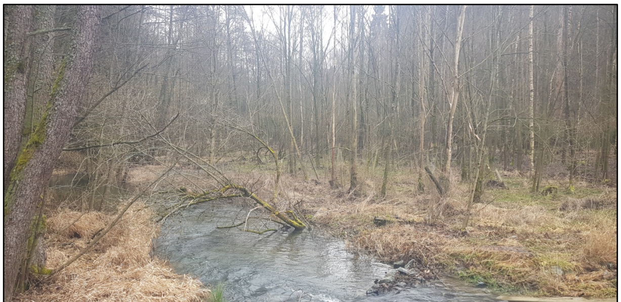
Abb. 6: Blick auf das unmittelbar angrenzende Jagdhabitat der Kreuzottervorkommen im Tetterweinbachtal