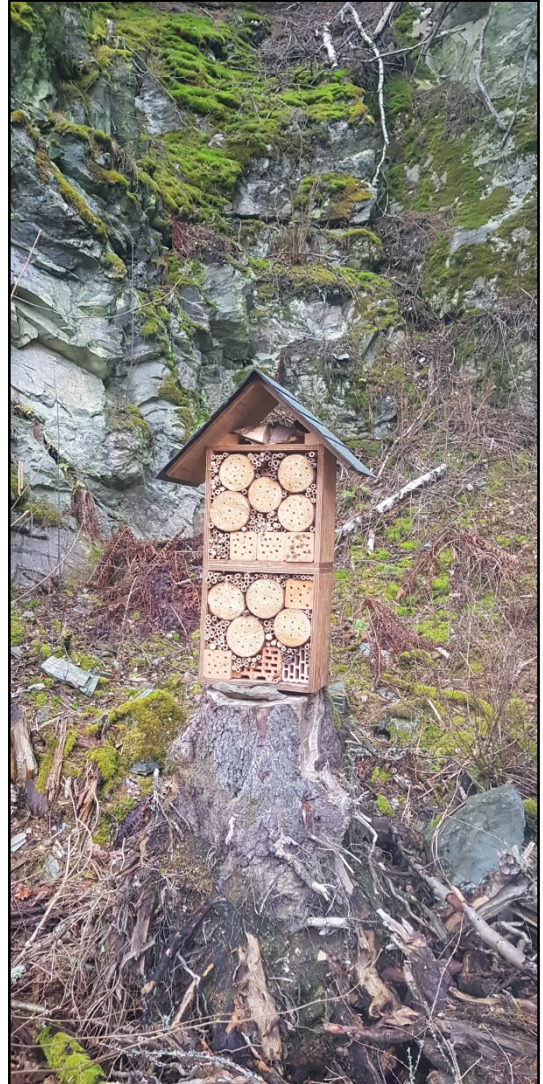
Abb. 4 und 5: Angrenzender Erlengaleriewald als bevorzugtes Jagdhabitat (links) sowie Insektenhotel (rechts) als biotoptypische Aufwertungsrequisite im Ruhehabitat der Kreuzotter